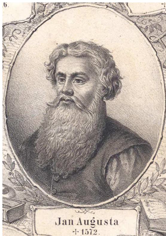
Josef Rupert Maria Přecechtěl, Jan Augusta, škof českých bratov, litografija, 1861.

dolžnosti vernika in v povsem drugačnem mestu plemstva med češkimi brati, kot so ga modrokrvneži iz dežel sv. Václava imeli dotlej. Češki bratje so sprejeli Luthrov pogled sola gratia in sola fide in v svojo konfesijo kot jedro evangelija umestili odrešitev zgolj po Božji milosti in veri v Jezusa Kristusa.