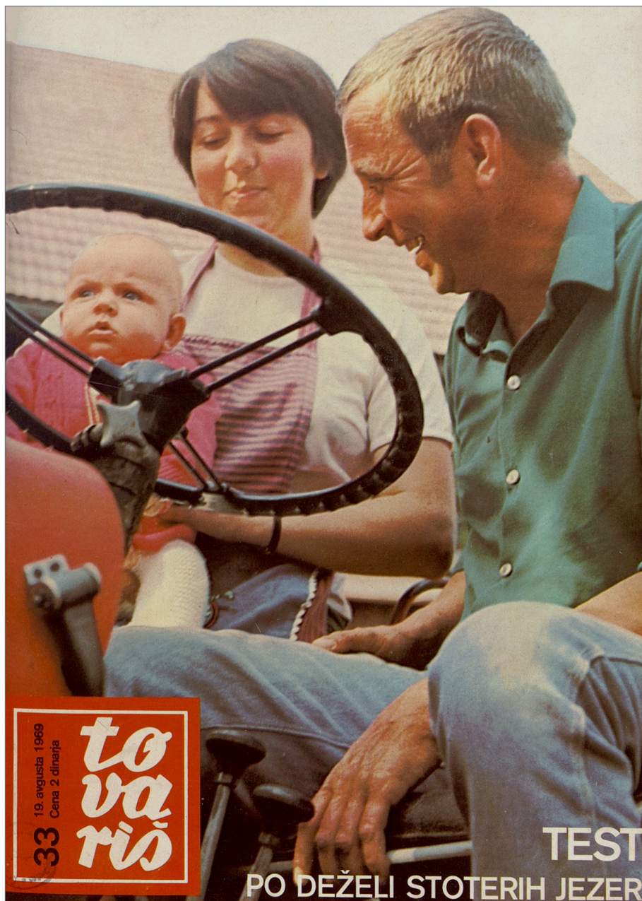
Slika 8: Družina na traktorju znamke Steyr iz vasi Žamanje na Koroškem na naslovnici časopisa Tovariš