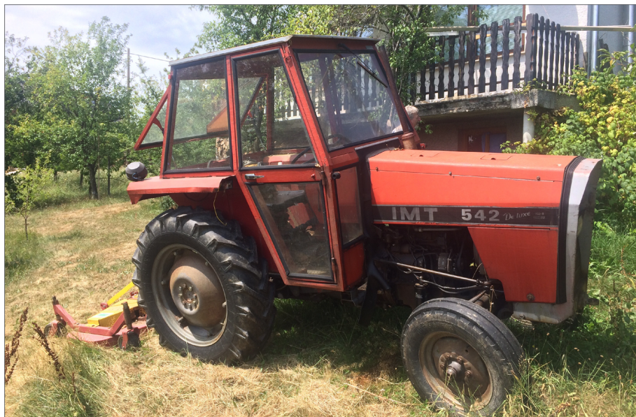
Slika 4: Ferijev prvi traktor znamke IMT 542 De luxe Avtorica: Polona Sitar.

klimo noter, ogrevanje. Še zdej ga mam. Tista vlka inflacija je takrat bla. In js ko sem sadjarstvo začel, sem ga vzel na kredit. Hranilno kreditna služba je bla v zadrugi in sem dobil kredit. Js sem kupo IMT-jevega te pa sem vido po tistem tega Zetorja. Ta se mi je bolj dopa-do, veš. In ajde, grem do direktorja, sma bla pač kolega na HKS-ju. Sn reko: »Čuj, js bi Zetorja kupo.« Pravi: »Ja, moraš eno tretjino pologa dati.« Pa sn reko: »Dobro, ti meni zdaj traktor prodaj, js bom unga IMT-jevega prodal, pa potem ko ga prodam, tretjino položim pologa.« Ker je tista vlka inflacija bla, js nisem nikol pologa dal pa mi je dal ce-lega na kredit. Ti povem, ka če dve leti sem eno plačo plačal, če je pa bla 100-odstotna inflacija. Z eno plačo sem plačal vse te kredite.