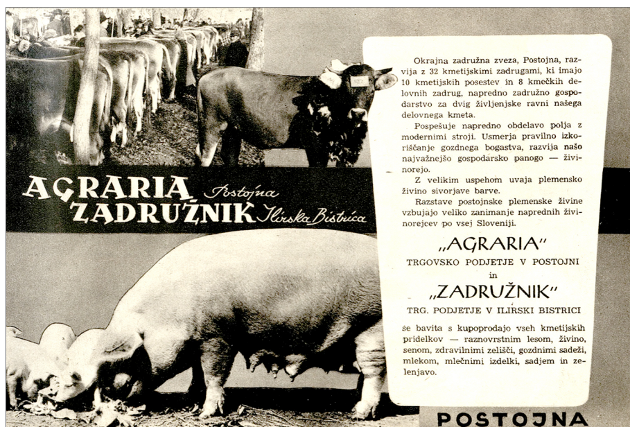
Slika 1: Oglas Okrajne zadrुžne zveze Postojna