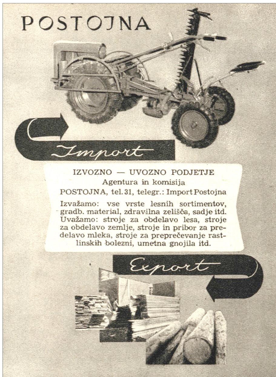
Slika 3: Oglas za izvozno-uvozno podjetje Agentura