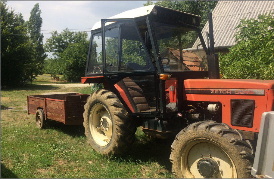
Slika 5: Traktor Zetor, parkiran na Ferijevev dvorišču

Če me je kdo videl, kok sem hitr zoral, je bil kr tiho, ker je poprej brano. Mladi smo prej prijel za nov način, oni so še zmer govoril: »Sej smo vedno na roke delal.«